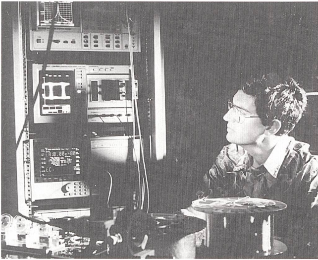
Versuchsaufbau, mit dem eine markante Steigerung der Kapazität von Glasfaser-Telekommunikationsnetzen erreicht wird.

man diesen Kanalabstand voraus, gibt es zwei Möglichkeiten für eine zusätzliche Erhöhung des Durchsatzes: Entweder wird die Bitrate für jeden Kanal erhöht, oder die gesamthaft beanspruchte Bandbreite wird verbreitert, um mehr Kanäle anzubieten. Die erste Lösung beinhaltet gewisse Einschränkungen aufgrund der Veränderung der Polarisation und der chromatischen Dispersion sowie der Modendispersion der installierten Glasfasernetze. Die zweite Lösung wird dank neuartigen optischen Verstärkern möglich, die auf Fasern aus Erbium-dotierten Fluoriden (EDFFA) basieren. Diese Verstärker weisen eine höhere Bandbreite als die auf Silizium basierenden optischen Verstärker auf. Es ist diese Lösung, die von Alcatel Telecom in einem Experiment vorgestellt wurde. Dabei wurden 16 10-GBit/s-Kanäle über 531 km Standardfasern, das heisst Fasern mit hoher Dispersion, mit grossen Abständen zwischen den Verstärkern, übertragen. Die Übertragungsleitung war zusammengesetzt aus sieben nicht dispersionskompensierten Einmodenfasern mit Längen zwischen 60 km und 93 km. Das Experiment zeigte somit, dass es möglich ist, die Leistungsfähigkeit von bereits installierten Glasfasernetzen auf kostengünstige Art und Weise zu verbessern.