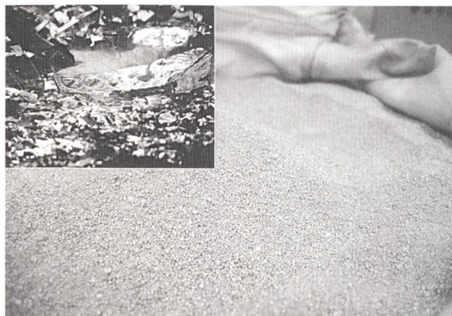
Aus Produktionsabfällen von Verbundstoffmaterialien (kleines Bild) kann Aluminium hoher Reinheit zur Wiederverwendung extrahiert werden.

Das Recycling dieser Verbundstoffe ist aufgrund der geringen Schichtdicke sowie der relativ hohen Anhaftungskräfte (Adhäsion) zwischen den einzelnen Schichten äusserst schwierig. Die konventionellen Trennmethode sind daher nur bedingt einsetzbar. Mit einer neuen Technologie geht nun die Trigo AG das Problem an. Im Gegensatz zu den konventionellen Aufbereitungen erfolgt der Aufschluss hier in einem «Beschleuniger», durch die Ausnutzung der physikalischen Unterschiede der sich im Verbund befindlichen Produkte (z. B. Al gegenüber PE). Der erwähnte Beschleuniger besteht im wesentlichen aus einem mehrstufigen Rotor, der sich mit hoher Geschwindigkeit relativ zum Gehäuse dreht. Durch die plötzliche und sich wiederholende starke Beschleunigung der Verbundstoffpartikel wird die Verbindung entlang der Phasengrenzen gelöst. Die abgelösten Schichten – Metalle, Cellulose oder Kunststoffe – erhalten dabei unterschiedliche Strukturen, Geometrien und Dimensionen. Die Metalle beispielsweise werden umgeformt und bauen sich «zwiebelartig» auf. Sie erreichen Dimensionen, welche um ein Mehrfaches grösser sind als zuvor im Verbund. Die Kunststoffe hingegen bleiben bezüglich Grösse im wesentlichen unverändert, verändern sich jedoch in ihrer Struktur. Das unterschiedliche Verhalten der Metalle und Kunststoffe bewirkt, dass sich