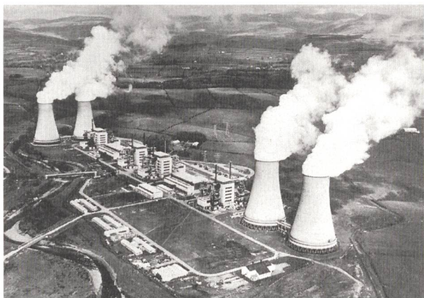
Calder Hall, la première centrale nucléaire commerciale du monde. Kernkraftwerk Calder Hall, das älteste kommerzielle Kernkraftwerk, ist seit 1956 in Betrieb.

(aspea) Le 17 octobre 1956, il y a donc 40 ans, l'installation de Calder Hall, la première centrale nucléaire commerciale du monde, était inaugurée par la reine Elisabeth II. L'ère de la production d'électricité nucléaire avait ainsi commencé. Calder Hall, qui se trouve dans le comté de Cumbria, au nord-ouest de l'Angleterre, continue de fonctionner avec une grande fiabilité.