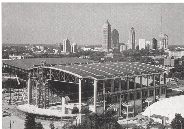
Das grösste dachintegrierte Solarkraftwerk der Welt auf dem Schwimmstadion in Atlanta.