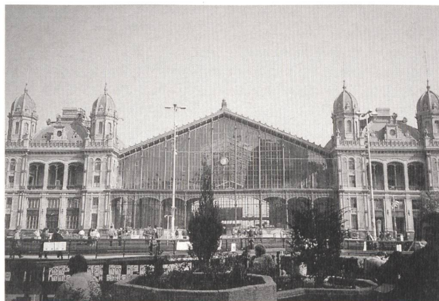
Budapest: Der Pester Bahnhof (Westbahnhof), der vom berühmten Gustave Eiffel erbaut wurde.

Die Tagung hat das Ziel, die Mitglieder der FKH und des VSE, die schweizerischen Elektrizitätswerke, die Herstel-