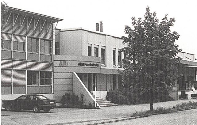
Der kundennahe Sitz der ABB Proelektra

GEC Alsthom und Daimler Benz haben einen Vertrag zum Erwerb der AEG-Aktivitäten auf dem Gebiet der Energieübertragung und -verteilung durch GEC Alsthom unterzeichnet. Im GEC-Alsthom-Konzern werden die AEG-Aktivitäten dem Bereich GEC Alsthom T&D (Transmission and Distribution) zugeordnet. Zur Dokumentation der gemeinsamen Aktivitäten beider Firmenteile und der Fortführung der über 100jährigen Tradition der AEG erfolgt der zukünftige Marktauftritt unter der Identität «AEG T&D». Das internationale Leistungsangebot von AEG T&D umfasst