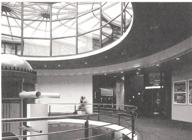
Bild 2 Das Tageslichtangebot wird optimal genutzt. Sowohl grosse Fensterflächen als auch der glasüberdachte Innenhof lassen viel Licht in das Gebäudeinnere fließen. Das flexible Lichtmanagementsystem stimmt das natürliche Licht mit dem Kunstlicht laufend ab.