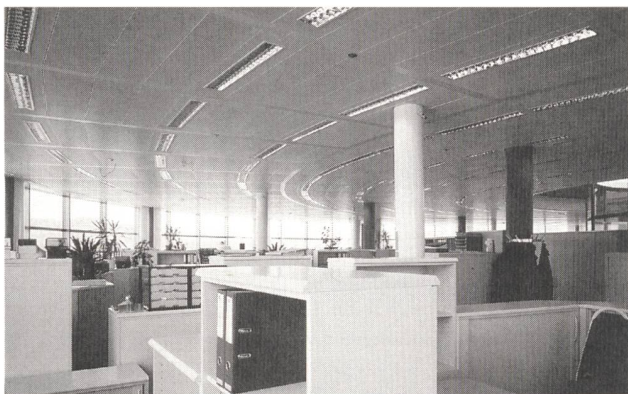
Bild 3 Die Leuchtenreihen sind in der Basiseinstellung über die Lichtmanagement-Installation mit dem Lichtangebot gemäss geschaltet: die am Fenster positionierten Leuchten bleiben bei genügend Tageslichtangebot ausgeschaltet, die mittleren Reihen sind auf einen Mittelwert und die dem Rauminneren zugewandten Leuchten auf 100% gedimmt.