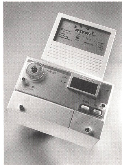
Bild 2 Mehrfach-Tarifgerät mit PLC-Interface für die Fernauslesung, montiert auf einem Haushaltszähler.

Das Modell kann als eine einzige Software-Anwendung betrachtet werden, bei dem zwei unabhängige Module auf eine Datenbank zugreifen (Bild 1). Das Modul «Technical Modelling» erlaubt es dem Benutzer, Szenarien zu entwickeln, die individuelle Netzwerk- und Kundensituationen abbilden. Jedem Szenario kann eine Schar Kommunikationstechnologien sowie eine Anzahl Funktionen überlagert werden. Das «Costing Modul» unterstützt den Anwender bei der wirtschaftlichen Betrachtung. Es berücksichtigt auch die zeitliche Staffelung bei der Einführung sowohl bei der Technologie als auch bei den Funktionen.