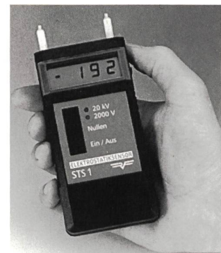
Das Multitalent STS 1 für Spannungen zwischen 2000 V und 20 kV

Das Elektrostatisksensorgerät STS 1 wurde zur Messung positiver und negativer statischer Aufladung entwickelt. Die Potentialerfassungselektrode ist im Gerät eingebaut. Die beiden Abstandshalter gewährleisten eine gleichmässige Distanz zum Testobjekt und damit eine genaue und reproduzierbare Messung. Das Gegenpotential wird entweder über den leitenden Schaumstoff an der Geräteunterseite durch den Benutzer oder über ein anschliessbares Erdungskabel realisiert. Der Messbereich von 2000 V bis 20 kV, die Messgenauigkeit von \pm 10\% , die geringe Drift und die Auflösung von bis zu 1 V machen das Modell STS 1 zu einem Multitalent in der Elektrostatisksmessung. So kann die statische Aufladung von EDV-Anlagen, von Elektronikfertigungsanlagen, von Wareneingangssystemen oder in