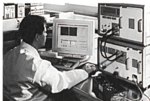
Kosteneffektive Investition für EMV-Testplätze

Die Überprüfung des Verhaltens von Geräten bei Surge-