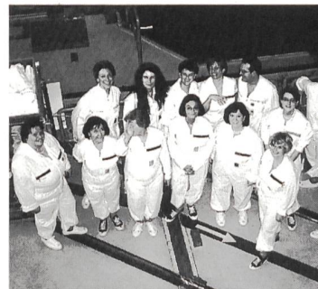
Im «Containment» des KKW Gösgen: die Teilnehmerinnen des Sekretärinnenseminars.

La manifestation a une nouvelle fois montré l'importance d'une politique d'information active au sein et à l'extérieur de la branche. Le forum sur la communication est un moyen permettant de satisfaire les besoins d'information des petites et grandes entreprises membres de l'UCS.