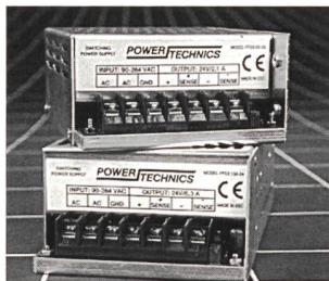
Industriestromversorgung der PTSX-Serie

Die von Power Technics entwickelte Single-Output-Industriestromversorgung der Serie PTSX ermöglicht Ausgangsspannungen von 12, 15, 24 oder 48 VDC. Lange Lebensdauer (MTBF von 300 000 Stunden