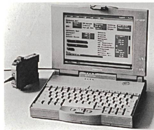
Polyvalenter Messumformer für den EX-Bereich

Der Messumformer ist ausgelegt zum Anschluss von Pt 100, Ni 100 und Thermolementen der Typen B, E, J, K, L, N, R, S oder T. Am Ausgang lässt sich ein temperaturlineares Stromsignal von 4 bis 20 mA generieren. Optional ist das Gerät auch mit einem Spannungsausgang zwischen 1 und 5 V erhältlich. Der Eingang ist