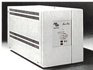
USV aus der Baureihe Netpro

Die speziell für die Belange des Netzwerkbetriebs geschaffene USV-Baureihe Netpro mit prozessorgestützter elektronischer Steuerung bietet Leistungen zwischen 600 und 4000 VA. Der Bedienerführung dient ein Tastenfeld mit LCD-Display, ergänzt durch mehrere Leuchtdioden für die Anzeige von Betriebszuständen. Die USV kann akustisch und visuell melden, wenn die Akkus zu erneuern sind. An vier Gerätesteckdosen lassen sich Server, Clients und Peripheriegeräte anschliessen. Ein Anschluss ist