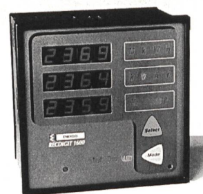
Systemfähiges Multifunktions-Powermeter für Fronteinbau

Das Modell 1600 C der neuen Recdigit-Reihe (Baugröße 144x144 mm für Fronteinbau) gestattet die Messung und Anzeige sämtlicher Parameter in gleich oder ungleich belasteten Drei- oder Vierleiter-Drehstromnetzen, einschliesslich Bezug und Abgabe von Wirk- und Blindenergie. Je nach gewünschten Messwerten und anderen Funktionen stehen fünf