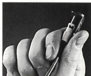
Schnell montierte Stecker für Lichtwellenleiter

3M-Fiberlok-Technik, einem mechanischen LWL-Spleiss. Die vorbereitete Faser wird durch den Crimplok gestossen,