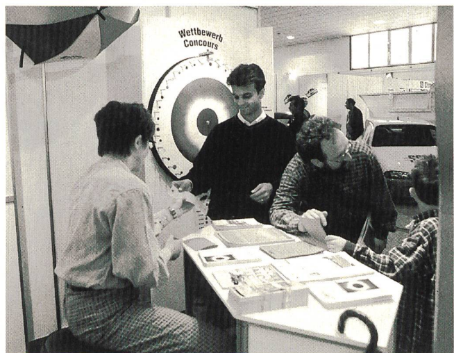
Beim Wettbewerb zum Thema Solarstrom am Stand des VSE versuchten über 600 Teilnehmerinnen und Teilnehmer ihr Glück.

In weiteren Kurzreferaten stellten Urs W. Muntwyler, Programmleiter des BEW, und Wilfried Blum, VSE, und Chefredaktor von MobilE die Gründe für das Engagement des BEW zugunsten der Elektrofahrzeuge, das heutige Marktangebot und den Stand des Grossversuchs des BEW mit Leichtelektromobilen in Mendrisio vor. Viel Beachtung