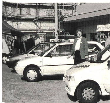
Am ersten Kontakttreff Elektromobile in Zürich konnten die verschiedenen Elektromobile auf einem Rundkurs probefahren werden.

Am Nachbarstand präsentierte sich das Elektrizitätswerk der Stadt Zürich (EWZ) mit seiner Solarstrombörse, welche es möglich macht, als Kunde im Versorgungsgebiet des EWZ Solarstrom zu beziehen. Ein weiterer Themenschwerpunkt war die Sonderschau «Elektrofahrräder», wo es über 30 verschiedene Modelle von Elektrovelos zu sehen gab. ■