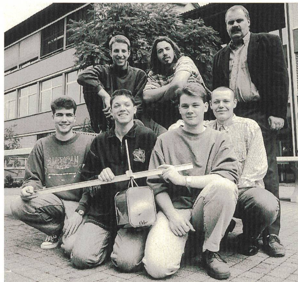
Die angehenden Elektromechaniker der Gewerblich-Industriellen Berufsschule Uster haben 1996 in der 3. Kategorie den 1. Preis gewonnen. Für die Beleuchtung und Käseproduktion auf der Alp Somodoss in Poschiavo bauten sie ein Kleinstwasserkraftwerk (Bild rechts).

Auch in der Energieanwendung geht es heute darum, neue Wege zu beschreiten. Dazu sind zunächst einmal gute Ideen nötig, die es dann gilt, erfolgreich umzusetzen. Die Schweizer Elektrizitätswirtschaft ist überzeugt, dass viele aussichtsreiche Energie-Innovationen in den Schubladen schlummern: Lösungen, die es verdienen, geweckt und realisiert zu werden. Dazu braucht es in erster Linie eine positive Haltung dem Neuen gegenüber. Die bisherigen acht Preisverleihungen haben gezeigt, dass es eine Fülle von innovativen, oft überraschenden und uner-