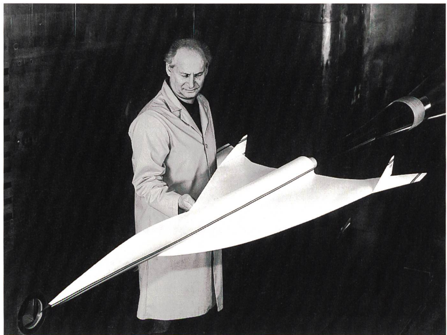
Bild 1 Ein Techniker im NASA-Windkanal mit dem Modell eines Überschallflugzeuges, dessen Aerodynamik einem Test unterzogen werden soll. Die Resultate ergeben bei entsprechender Anpassung von Luftgeschwindigkeit und Lufttemperatur ein getreuliches Abbild des Flugverhaltens des späteren Flugzeuges. Dies setzt ein leistungsstarkes Synchronantriebssystem mit variabler Drehzahl voraus.

Neue Flugzeugentwicklungen müssen im Windkanal getestet werden. Solche Testmöglichkeiten stellt die NASA mit ihrer Windkanalanlage National Transonic Facility (NTF) in Hampton im US-Bundesstaat Virginia der Flugzeugindustrie als kommerzielle Dienstleistung zur Verfügung. Im Windkanal getestet werden aber nicht die eigentlichen Flug-