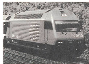
Lok 2000 – Einsatzgebiet von Amherd-Widerständen

Weitere Widerstände, wie zum Beispiel Bremswiderstände, die Widerstände in Alugehäusen, Industrie-Widerstände, regulierbare Widerstände usw. sind ebenfalls in