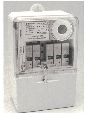
Rundsteuerempfänger RO5 mit fünf 16-A-Relais

Der Rundsteuerempfänger RO5 wurde speziell für den Schweizer Markt entwickelt. In seinem kompakten Gehäuse