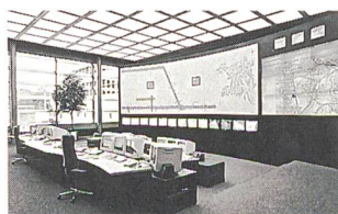
Bildschirmarbeitsplätze von Erich Keller AG

Erich Keller AG, 8583 Sulgen Tel. 071 644 88 88, Fax 071 644 88 80 http://www.erichkeller.com