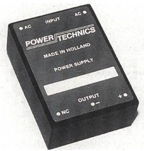
Stromversorgungen als AC/DC-Module

Die Single- bzw. Multioutput-Stromversorgung für Industrieapplikationen eignet sich für die Printmontage oder für die Montage auf Trägerelementen. Es handelt sich bei dieser Anschlussart um Schraubklemmen. Die Leistung der Kompaktmodule beträgt bis zu 25 W, wobei drei Ausgangsspannungen mit CE-konformer Stromversorgung erhältlich sind. Die vergossenen Leistungsteile sind auf lange Lebensdauer getrimmt, hohe Zuverlässigkeit und Effizienz sollen zur Ko-