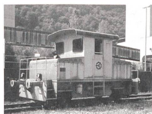
Die Rangierlok Stadler Ta 2/2 soll modernisiert werden.

wird direkt die Fahrgeschwindigkeit bestimmt. Durch die neue Parallel-/Serie-Schaltung der zwei Akkumulatoren mit 180/360 Volt und die Parallel-/Serie-Schaltung der Gleichstrommotoren können 14 Fahrstufen realisiert werden. Im unteren Fahrbereich wird mit der feineren Abstufung praktisch ein stufenloses Fahrverhalten erreicht. Allerdings ist in diesem Betrieb der Wirkungsgrad der Lok recht ungünstig, weil ein grosser Teil der Spannung über den Vorwiderständen in Wärme umgewandelt wird.