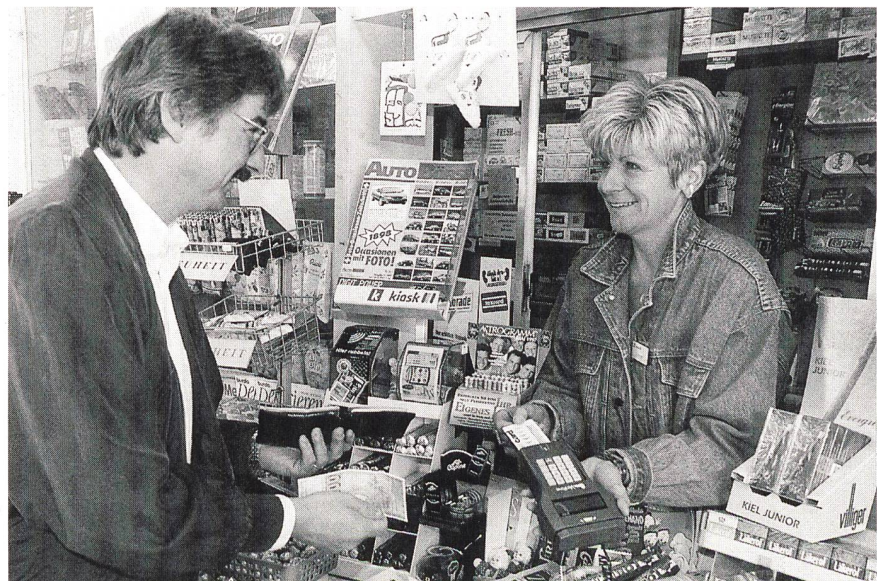
Bild 1 Stromeinkauf am Kiosk: So einfach kann der Strom von den Teilnehmern am Pilotprojekt der Städtischen Werke Baden (StWB) am Kiosk im Badener Wohnquartier Kappelerhof eingekauft werden.

Das Valcom®-System besteht aus Energiezähler mit Kartenleser, Chip-Karte als Kommunikationsmedium, Zahlstelle und Zahlstellenzentrale sowie Kontrol-