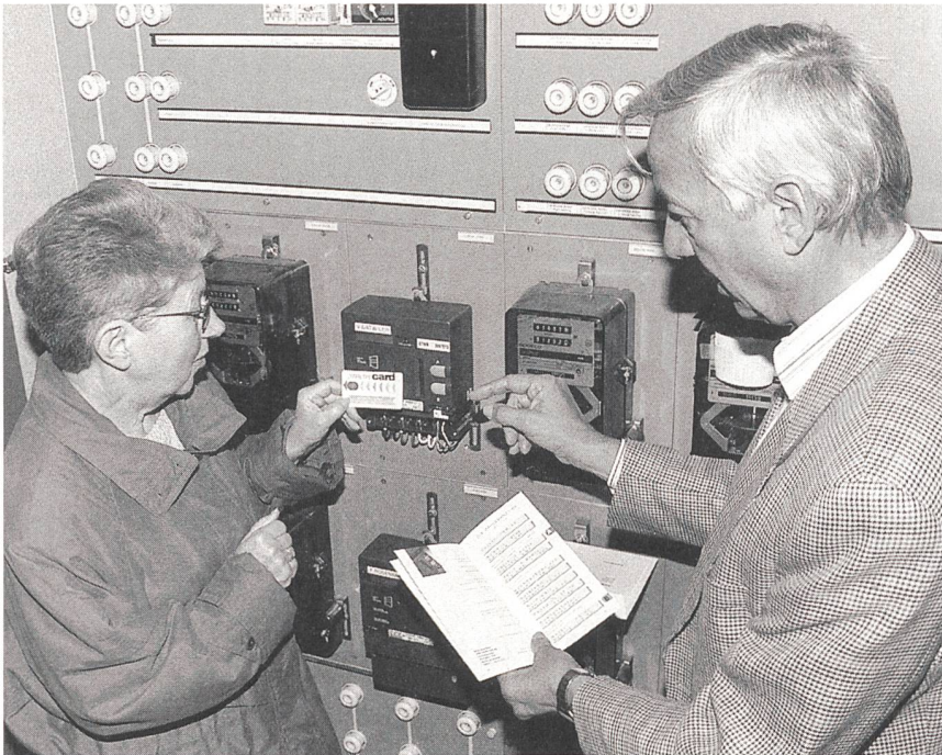
Bild 2 Von der «Smart Card» Strom auf den Zähler laden: 100 Kundinnen und Kunden der Städtischen Werke Baden (StWB) testen in einem auf zwei Jahre befristeten Pilotprojekt ein neuartiges Energiezahlungssystem. Herzstück des Systems ist eine «Smart Card», die Informationen und Kredit für den Energiebezug zwischen Elektrizitätswerk und Haushaltzähler transportiert.

ler, der für das EVU als Steuerzentrale funktioniert (Bilder 3 und 4).