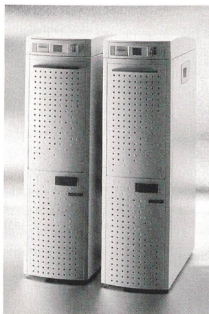
Highscreen Alpha 533 SX und Alpha 533 LX

Als Ergebnis der strategischen Partnerschaft zwischen Vobis und Digital sind die beiden Systeme Highscreen Alpha 533 SX und Highscreen Alpha 533 LX erhältlich. Im System Highscreen Alpha SX befindet