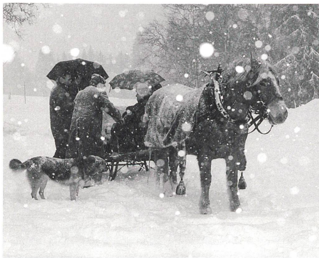
Stimmungsbild der Winterlandschaft anlässlich des Ausfluges der COCOM zum Windkraftwerk Mont-Croisin.