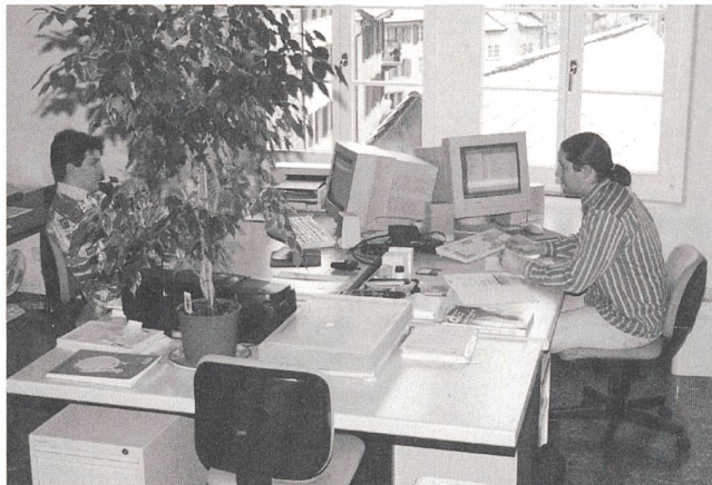
Über der Dachlandschaft der Rapperswiler Altstadt werden neue Ideen umgesetzt.

Gründungen und erste Aktivitäten offen. Damit sollen in einer Phase des Arbeitsplatzabbaus neue Firmen und Arbeitsplätze in Wachstumsbranchen gefördert werden, betonte Stiftungsratspräsident Thomas Schmidheiny bei der Vorstellung der Stiftung und des Hauses Herrenberg 35. Das Haus