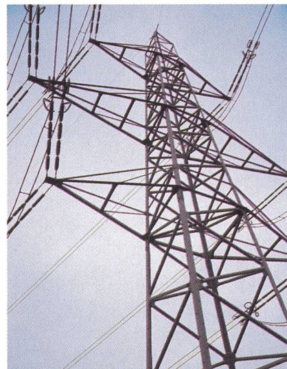
Titelbild: Dynamische Entwicklung der Schweizer Elektrizitätswirtschaft.

Bulletin SEV/VSE 8/1998 Zürich, 17. April 1998 89. Jahrgang