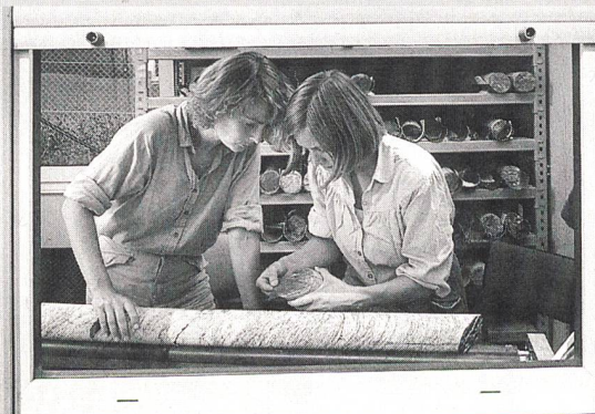
Erdwissenschaftliche Untersuchung von Bohrkernen.

Die Nagra (Nationale Genossenschaft für die Lagerung radioaktiver Abfälle) wird, nachdem sie die rechtskräftige Baubewilligung für die Sondierbohrung in Benken (ZH) erhalten hat, ab Ende März den Bohrplatz vorbereiten. Je nach Witterung dauern diese Arbeiten rund 14 Wochen. Der Bohrbeginn wird somit im Laufe des Sommers erfolgen. Bei der Sondierbohrung geht es um das Beschaffen von Grundlagen für den Nachweis, dass auch in der Schweiz hochradioaktive Abfälle sicher entsorgt werden können.