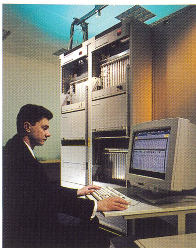
Umfassendes Network-Management für Transport und Access-Level.

Seit es EVU-spezifische Kommunikationseinrichtungen gibt, und das ist schon rund sechzig Jahre her, arbeitet ABB Network Partner Hand in Hand mit ihren Kunden in dieser Branche. Wir kennen alle Prioritäten und auch die besonderen Bedürfnisse rund um die Energienetze. Durch die enge Zusammenarbeit mit Nortel können wir jetzt integrierte Lösungen mit Produkten von STM-1 bis STM-64 anbieten, inklusive umfassenden Network-Management-Funktionen – alles selbstverständlich in Kombination mit unserer bewährten FoxNet-Palette für den Access-Bereich.