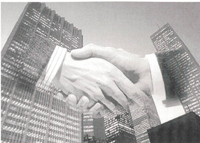
Beim Handshake zwischen Siemens und Landis & Gyr hat die technische Kompetenz der Zuger dem Standort Schweiz Erfolg beschert.

Existierende Verfahren zur Darstellung dreidimensionaler Bilder benötigen spezielle Brillen, Prismen oder andere teure