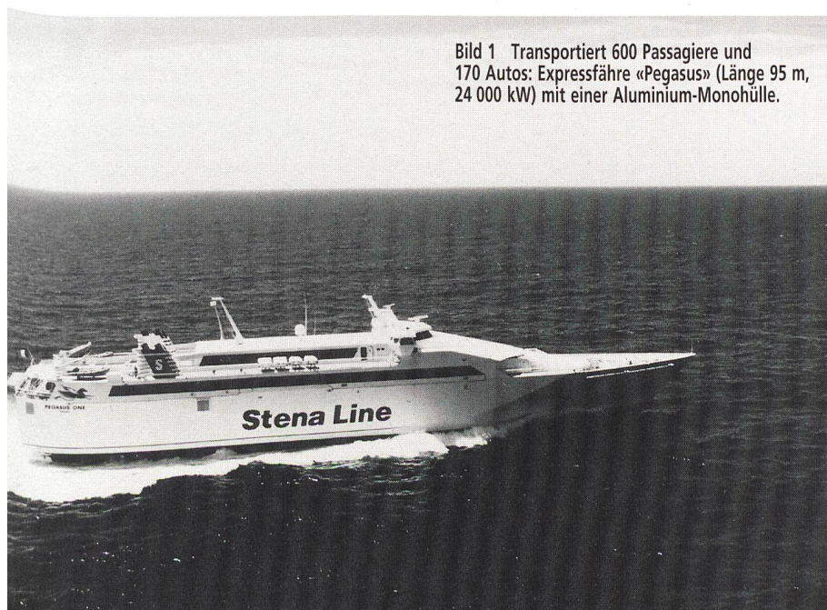
Bild 1 Transportiert 600 Passagiere und 170 Autos: Expressfähre «Pegasus» (Länge 95 m, 24 000 kW) mit einer Aluminium-Monohülle.

Eine wichtige Rolle spielt Aluminium auch im Flugzeugbau. Etwa 60 bis 80% einer Flugzeugstruktur bestehen aus Alu-