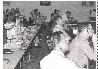
Aufmerksame Zuhörerinnen und Zuhörer am Kommunikationsforum in Martigny. Das nächste Forum findet am 26. Januar 1999 im CS-Forum in Zürich statt.

Anschliessend an das Forum wurde die Baustelle von Cleuson-Dixence besichtigt.