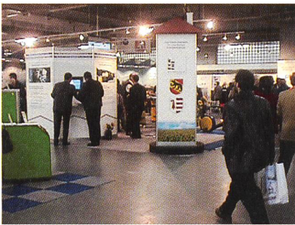
Bild 1 Die Wärmepumpen-Ausstellung in der BEA bern expo bot vielen Besuchern eine kompakte und doch umfassende Informationspalette.