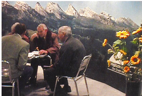
Bild 6 Interessierte Besucher vor traumhafter Kulisse.