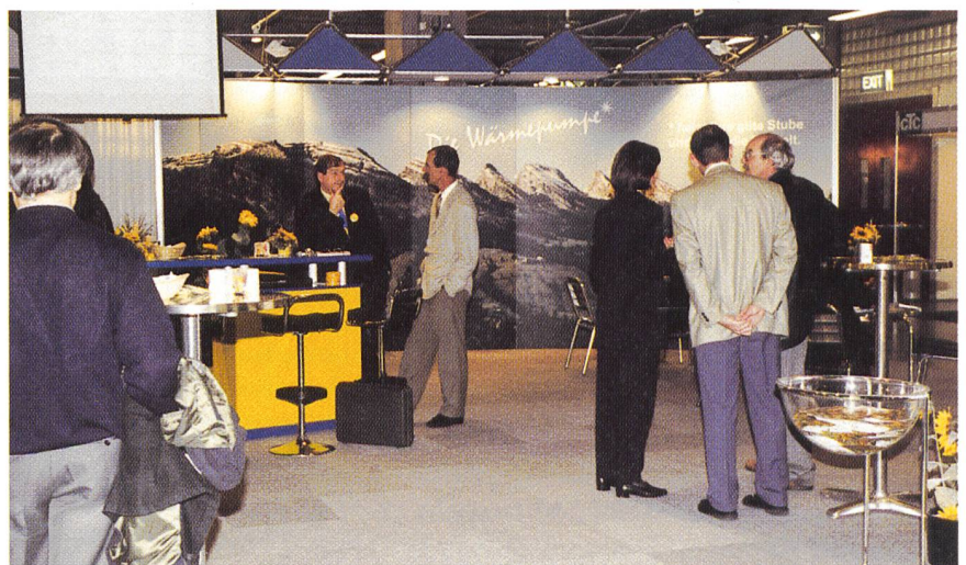
Bild 2 Gemeinschaftsstand der Elektrizitätswirtschaft und des Wärmepumpen-Testzentrums.

Im Workshop 1 unter dem Titel «Gute Geschäfte mit Wärmepumpen – warum, womit und wie?» wurde vor allem für Anlagenbauer und Installateure aufgezeigt, dass richtig konzipierte Wärmepumpen durchaus ein interessanter Geschäftsbereich sein können. Einleitend