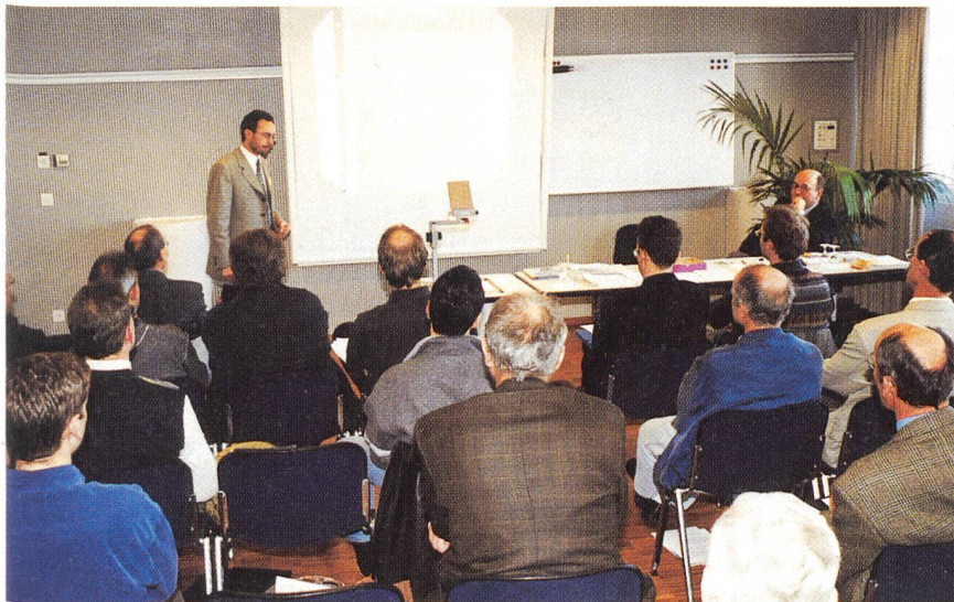
Bild 4 Eines der wichtigsten Elemente dieser «Kongress-Messe» bilden jedes Jahr die für Fachleute konzipierten Workshops.