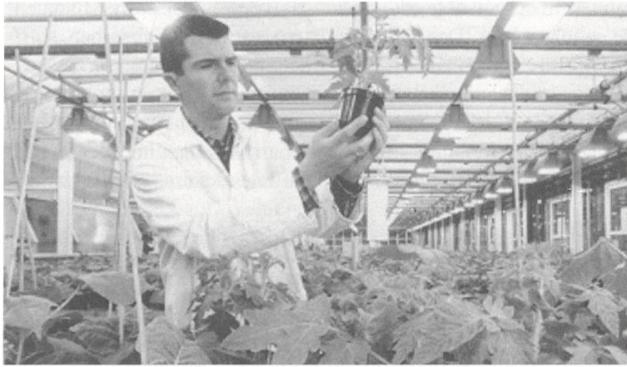
Pflanztöpfe aus biologisch abbaubarem Kunststoff

eine ausreichend feuchte Umgebung mit Bakterien, Pilzen und Mineralien. Dabei zersetzt sich das Material vollständig in Wasser, Kohlendioxid und Humus.