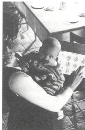
Haustechnik und elektrische Geräte kommunizieren zusammen.

Bürokomplexen, Krankenhäusern oder Hotels unter Beweis gestellt. Das darauf aufbauende Siemens-HES soll einiges bieten: Vergessliche können beim Verlassen der eigenen vier Wände einen Schalter neben der Haustür betätigen, der gleichzeitig die Alarmanlage scharfstellt, die Heizungstemperatur absenkt, die gesamte Beleuchtung sowie alle nicht benötigten elektrischen Verbraucher ausschaltet und eine Anwesenheitssimulation aktiviert, die vor Einbrechern schützt. Daneben soll sich der Nutzen des Systems besonders beim Einsatz in Niedrigenergiehäusern zeigen.