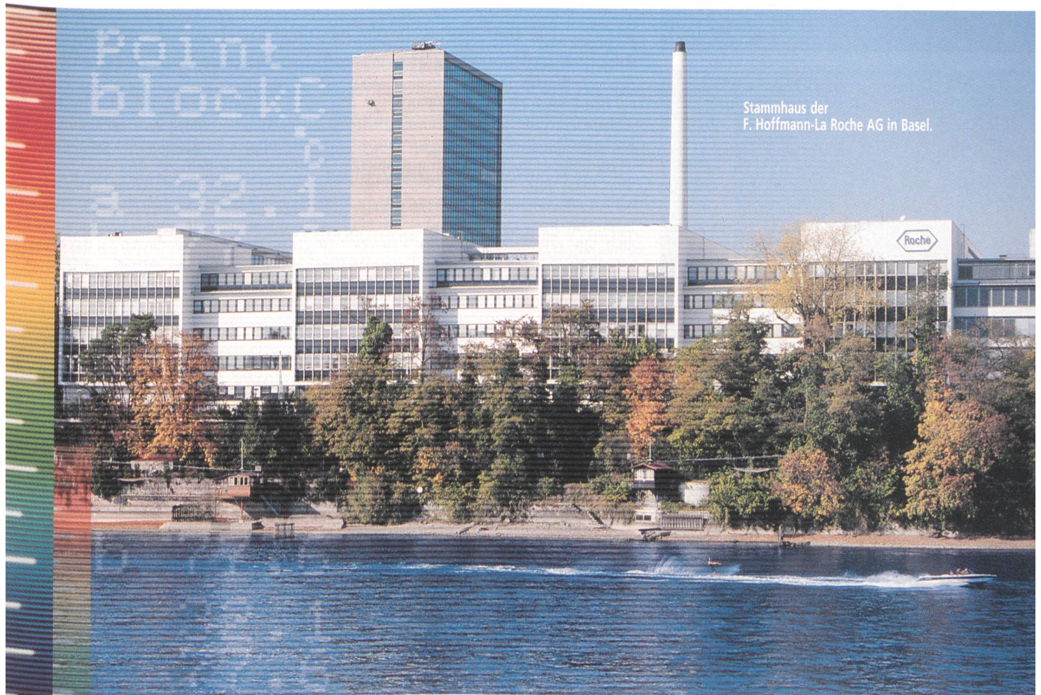
Stammhaus der F. Hoffmann-La Roche AG in Basel.

Um elektrische Anlagen zu überprüfen, ist die Infrarot-Thermographie ein bewährtes Verfahren. Hier sucht eine für Wärmestrahlung empfindliche Kamera nach Verbindungsstellen mit erhöhter Temperatur. Ziel der thermographischen Messungen ist, über die Oberflächentemperatur eventuelle Schwachstellen zu ermitteln. Diese Methode wurde bei der F. Hoffmann-La Roche AG in Basel eingesetzt, um die Qualität der von Siemens umgebauten Arealstromversorgung zu überprüfen. Im gesamten Leistungsteil waren die Verbindungen und Komponenten zu 99,9% in Ordnung.