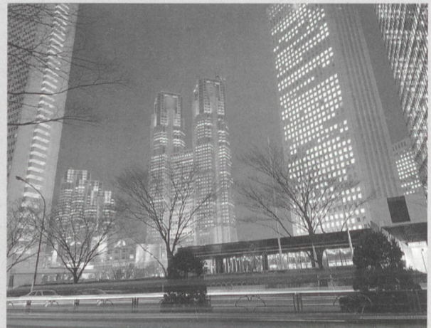
Die japanische Wirtschaft läuft zu 30% mit Kernenergie (Geschäftsviertel in Tokio).

(sva) Die drei japanischen Kernkraftwerksbetreiber Japan Atomic Power Co. (JAPCO), Kansai Electric Power Co. (KEPCO) und Tokyo Electric Power Co. (TEPCO) richten sich darauf ein, ihre ältesten Kernkraftwerksblöcke während 60 Jahren zu betreiben. Sie haben Pläne angekündigt, die Lebensdauer der schon bald 30 Jahre in Betrieb stehenden Einheiten Tsuruga-1, Fukushima Daiichi-1 und Mihama-1 entsprechend zu verlängern, und jetzt beim zuständigen Ministerium (MITI) diesbezügliche Vorstösse unternommen. Nach Ansicht der drei Betreiber stellt die Lebensdauerverlängerung keine grundsätzlichen Probleme. Sie erfordert jedoch gezielte Massnahmen zur Reparatur, Nachrüstung und vertieften Prüfung bestimmter Komponenten. Die entsprechenden Programme sind ausgearbeitet und sollen ab dem 30. Betriebsjahr implementiert werden. Vorgesehen ist unter anderem eine Neubeurteilung der Sicherheit alle zehn Jahre.