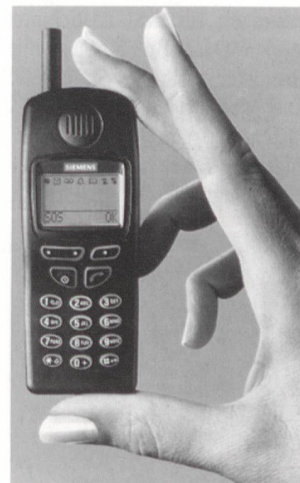
Dualband-Handy C25 für Einsteiger

Das Dualband-Handy C25 unterstützt Triple Rate, das heisst es funktioniert im GSM-900er- und im GSM-1800er-Netz und wechselt automatisch hin und her. Damit passt es sich flexibel allen Telefonkarten und Netzumgebungen an und bleibt zum Beispiel auch bei Kapazitätsengpässen im Mobilfunknetz einsatzbereit. Siemens orientiert sich an jungen Mobilfunkeinsteigern im Alter zwischen 15 und 29 Jahren, da