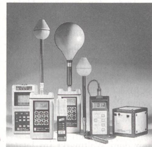
Messgeräte zur Bestimmung von magnetischen und elektrischen Feldern

Seit Anfang Februar vertritt die LEM Elmes AG, Pfäffikon SZ, in der Schweiz das Produktsortiment der Firma Wan-