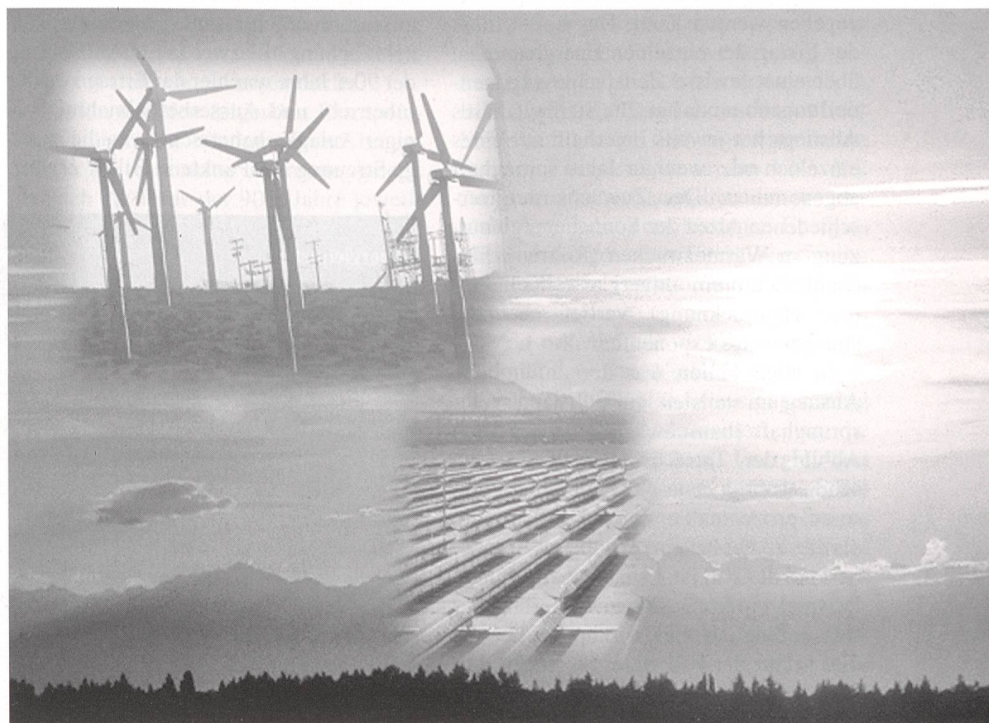
Welche Rolle werden die erneuerbaren Energiequellen künftig spielen?

Die brennbaren Anteile im Kehrlicht gehen in der Tat letztlich auf erneuerbare organische Stoffe zurück, während Wär-