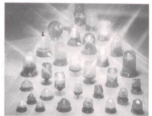
Une ligne optique conforme aux normes européennes

Sirena offre avec la ligne optique un vaste programme d'appareils de signalisation éprouvés, destinés à l'industrie et conformes aux prescriptions des normes européennes. Toutes les lampes sont disponibles avec des calottes de différentes teintes pour des tensions de service en courant alternatif et continu de 6 à 240 V. L'offre comprend les feux tournants avec modèles équipés d'une lampe à incandescence ou halogène pour usage intérieur ou extérieur, les feux clignotants avec lampe à incandescence ou halogène, feux à lumière fixe et à éclats. Les avertisseurs optiques et acoustiques sont aussi très efficaces avec feux à éclats ou clignotants combinés avec une sirène électronique magnétodynamique. Les nombreuses possibilités de signalisation conviennent à une très large utilisation industrielle.