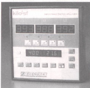
Kilo-EEM erfasst Ereignisse in Dreiphasennetzen.

Das Gerät Kilo-EEM wurde für die Erfassung, Speicherung und Analyse von Ereignissen in Dreiphasennetzen konzipiert.