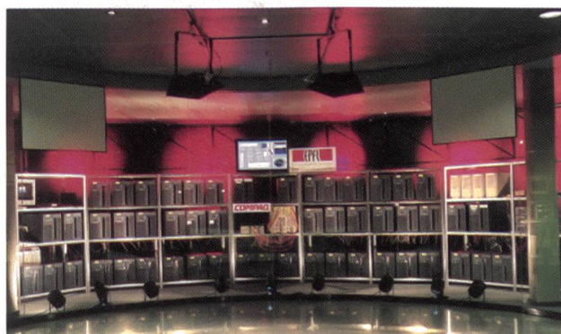
Ein Supercomputer aus Standardkomponenten

Bisher blieb die Ausführung von Applikationen mit grossen Rechenleistungen den grossen Universitäten, den Forschungslabors, wenigen Grossanwendern aus Industrie und Dienstleistung sowie den Anwendern aus dem militärischen Bereich vorbehalten. Die Verfügbarkeit von Hochleistungssystemen auf der Basis von Standardkomponenten wird es jedoch schon bald einer grösseren Zahl von Anwendern erlauben, solche Maschinen zu weit geringeren Kosten als jene der herkömmlichen Supercomputer einzusetzen.