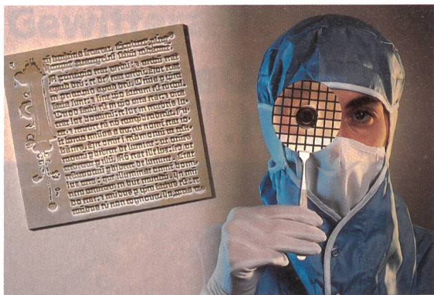
Cette réduction au dix millième d'un extrait de la Bible de Gutenberg illustre les possibilités du coulage par injection: L'empreinte en matière plastique occupe une surface à peu près de la taille d'une bactérie sur le disque compact.

tut Paul Scherrer (PSI) est parvenu à reproduire dans un matériau plastique des structures inférieures au dixième de micron par gaufrage. La photolithographie, procédé standard pour la fabrication des circuits microélectroniques, ne permet pas d'obtenir des motifs aussi fins. Le groupe du PSI, qui bénéficie du soutien du Fonds national suisse dans le cadre du programme national de recherche Nanosciences, a expérimenté avec succès encore un autre procédé, le coulage par injection. Cette réussite est le fruit d'une collaboration avec la haute école spécialisée du canton d'Argovie et un partenaire industriel. Les deux méthodes sont prometteuses pour produire, en grandes séries et à peu de frais, des composants de seulement quelques dizaines de nanomètres, destinés par exemple à des capteurs minuscules et à des mémoires très compactes.