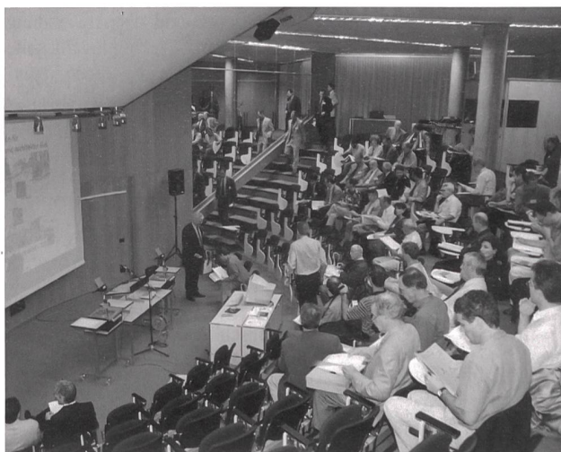
Über 100 Teilnehmerinnen und Teilnehmer haben sich an der nationalen Wind-Solar-Tagung '99 in Biel über Entwicklungsstand, Chancen und Möglichkeiten von neuen Energietechnologien in der Schweiz informiert.

betonte, dass bei den kristallinen Solarzellen in den nächsten Jahren zwar graduelle Verbesserung möglich, aber keine Quantensprünge zu erwarten seien. Weiter verwies er auf die Forschungstätigkeit auf dem Mont-Soleil, die sich als Bindeglied zwischen der Photovol-