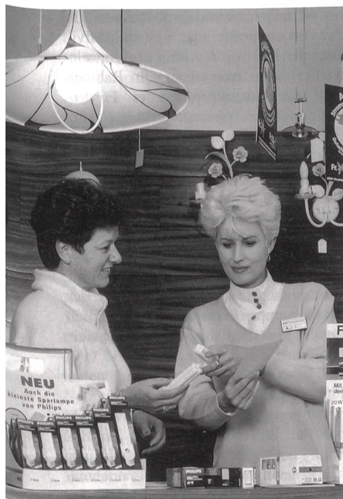
Aktive Rolle bei Information und Beratung.

Die Energieberater der beiden Organisationen «Vereinigung der Anwendungs- und Beratungsfachleute (VAB)» und «CLUBénergie» tauschen wertvolle Erfahrungen aus und erhalten mit der «VAB-Dokumentation» bzw. dem «Ma-