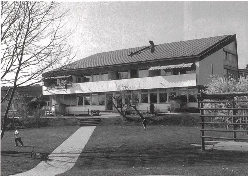
«Solarstrom vom EVU»: zum Teil aus eigenen Solaranlagen des EVU, zum Teil bei Dritten eingekauft (PV-Anlage auf Mehrfamilienhaus).

Die Produktion dieses Stroms erfolgt nur zum Teil in eigenen Solaranlagen des EVU, zum Teil wird der Solarstrom bei Dritten zur Deckung der Bedürfnisse der Kunden eingekauft. Diese Anlagen erscheinen dann aber nicht in der Statistik der EVU-Anlagen in Tabelle II. Die insgesamt im Rahmen dieser Aktion generierte Nachfrage nach Solarstrom entspricht etwa 2100 kW installierter Leistung von Photovoltaikanlagen, weitere Anlagen in der Grössenordnung von 950 kW sind in Planung.