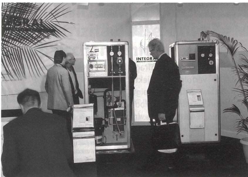
Beteiligung der EVU an der WP-Expo in Bern.

nual de Référence» eine aktuelle Grundlage für die Beratung.