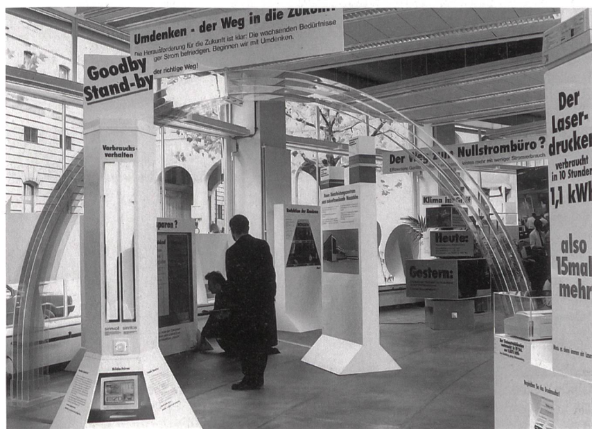
Mit Ausstellungen, Informationszentren den bewussten Umgang mit Strom vermitteln.

Aktionsprogramm «Energie 2000» 9. Jahresbericht des Verbands Schweizerischer Elektrizitätswerke (VSE) Berichtsperiode: 1. Juli 1998 bis 30. Juni 1999