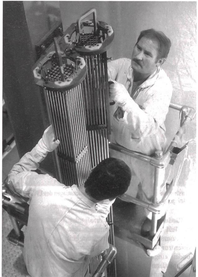
Kernkraftwerke: Erhöhung der Leistung (Brennelementbündel, Bild KKL).

Aufgrund des Preisdruckes im Zusammenhang mit der Öffnung des Strommarktes sowie der anstehenden zusätzlichen Verteuerungen der Wasserkraftproduktion (z. B. Partnerwerksbesteuerung, Energie-Umwelt-Initiative) sind Projekte für Neu-, Um- und Erneuerungsbauten von Wasserkraftwerken viel schwieriger zu realisieren. Zusätzlich als investitionshemmend erweisen sich die langwierigen und komplizierten Bewilligungsverfahren.