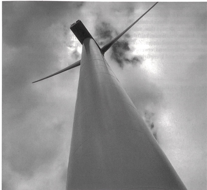
Nutzung der Windenergie weiter ausgebaut (Windturbinenrotor).

Die mittlere Produktions expectation aus Wasserkraft von 33 000 GWh (Stand 1.1.91) soll bis zum Jahr 2000 um 5% gesteigert werden, entsprechend 1650 GWh. Im 9. Berichtsjahr von «Energie 2000» konnte der Neu- bzw. Umbau von 16 Wasserkraftanlagen abgeschlossen werden. 14 Anlagen befinden sich im Bau. Die Leistung konnte dabei um insgesamt rund 65,11 MW, die mittlere Jahresproduktion um rund 76,45 GWh gesteigert werden. Die Zwischenbilanz zeigt, dass der momentan absehbare Ausbau der Wasserkraft bis zur Jahrhundertwende 1250 GWh erreichen wird. Das Ziel «plus 5%» dürfte somit zu rund drei Vierteln erfüllt werden.