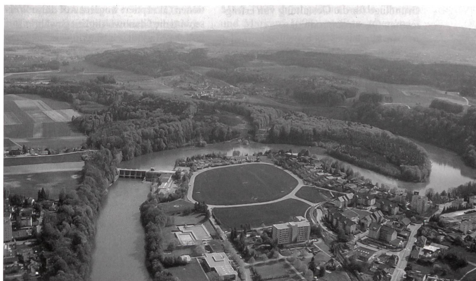
Die Zertifizierung der Wasserkraft stellt für die Schweiz ein zentrales Thema dar.

EAWAG Eidgenössische Anstalt für Wasserversorgung, Abwasserreinigung und Gewässerschutz Seestrasse 79 6047 Kastanienbaum www.oekostrom.eawag.ch