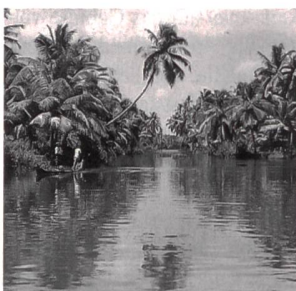
Kerala (Indien): hohe Strahlung aus natürlichen Quellen.

(sva) Im indischen Bundesstaat Kerala wurde bei 100 000 Personen in einem Gebiet, dessen radioaktive Strahlung aus natürlichen Quellen um einen Faktor fünf bis 30 über dem