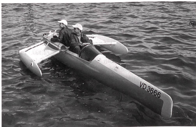
Eine 300-Watt-Brennstoffzelle treibt den Trimaran: Zwei Ingenieurstudenten aus Yverdon gleiten lautlos übers Wasser.

In den vorgestellten und diskutierten tragbaren Geräten waren vor allem Fest-Polymer-Elektrolyte integriert. Es wurden aber auch Festoxid-Zellen direkt mit Flüssiggas betrieben. Mit Direkt-Methanol-Zellen lässt sich der Brennstoffzellen-Effekt gut demonstrieren. Das 12-Volt bis 15-Watt-Gerät (portAcell) mit integriertem Wasserstoffherzeuger dürfte für die Demonstration der Technik besonders interessant sein, da