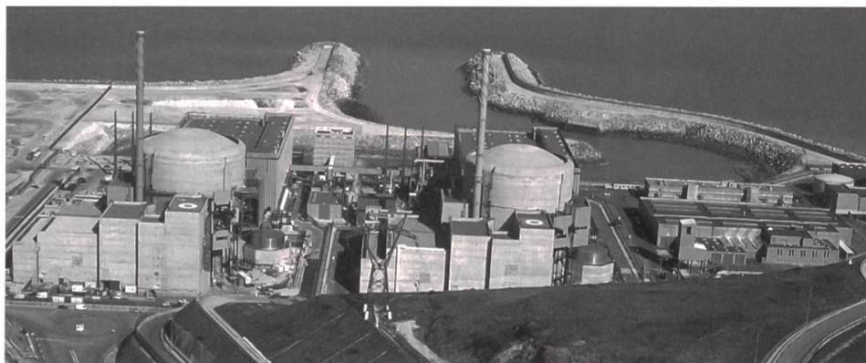
Passage à l'an 2000: la sûreté des centrales nucléaires est assurée (centrale de Penly; 1330 MW).

weltweiten Durchschnitt liegt, keine erhöhte Krebshäufigkeit festgestellt. Besonders hoch, oft über dem Grenzwert für beruflich strahlenexponierte Personen, ist die Strahlung in der dortigen Küstenregion mit den berühmten schwarzen Sandstränden, die aber gemäss Studie auch kein erhöhtes Krebsrisiko bewirkt. Als Kontrollgruppe für die Erhebung wurden 300 000 Personen aus anderen Gebieten von Kerala untersucht, in denen die natürliche Strahlenexposition nicht über dem Durchschnittswert liegt.