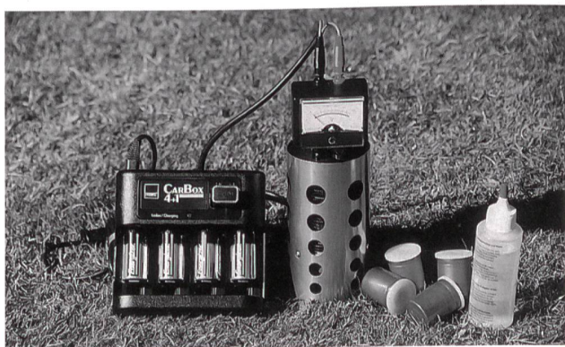
15-Watt-Brennstoffzelle zur Nachladung von Batterien mit integriertem Wasserstoffherzeuger: Wasser plus «Stoff» ergibt Wasserstoff.