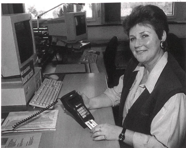
An der Zahlstelle wird der Wert der gewünschten Menge Strom auf die Chipkarte geladen.