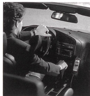
Wählen und sprechen mit beiden Händen am Lenkrad.

(sie) Für das neue S25-Handy bringt Siemens mit «Car Kit Professional Voice» eine Freisprecheinrichtung mit Stimmerkennung auf den Markt. Diese Innovation funktioniert bis auf das Einschalten vollständig sprachgesteuert und sorgt damit für mehr Sicherheit im Strassenverkehr. Siemens «Portable» eignet sich hingegen für schnelles Wechseln von einem zum anderen Fahrzeug. Ohne technischen Aufwand lässt sich das mobile Freisprechset schnell einsetzen und ebenso leicht wieder entfernen.