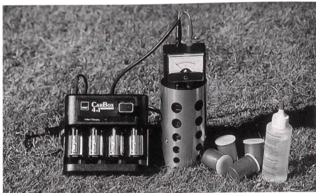
15-Watt-Brennstoffzelle zur Nachladung von Batterien mit integriertem Wasserstoffherzeuger: Wasser plus «Stoff» ergibt Wasserstoff.