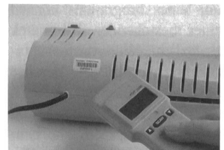
Strichcodescanner Inventory 2.0

Mit dem Inventarverwaltungsprogramm Inventory 2.0 von Securmark wird die Inventarverwaltung wesentlich vereinfacht. Die unbeliebte, aber notwendige Prozedur der Inventarerfassung kann auf einfache Weise rationalisiert werden. Sämtliche Daten der Gegenstände werden im Programm registriert. Mit einem