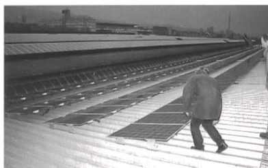
Die Solarstromanlage auf dem Perrondach des HB Zürich bei Einbruch der Dunkelheit.

(pm/eb) Auf dem Perrondach des Hauptbahnhofs Zürich wurde am 16. November eine 50-Kilowatt-Solaranlage eingeweiht. Die Anlage ist seit dem 1. Oktober 1999 in Betrieb und wurde vom energie büro geplant und projektiert. Für die Realisierung von Solarstrom-