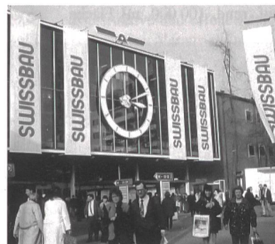
Swissbau 2000, die grösste Schweizer Baumesse, vom 25. bis 29. Januar in Basel.