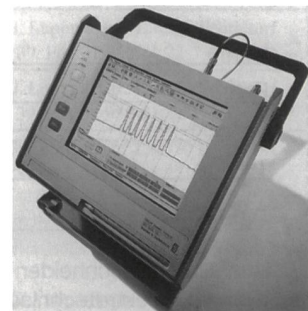
DWDM-Messsystem mit LCD-Bildschirm

stallation und Inbetriebnahme, Wartung und Störungssuche in DWDM-Systemen. Darüber hinaus kann der OSA-155 zu-