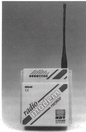
Datenfunkmodem für SPS

RM9600 ist ein neuartiges Datenfunkmodem für die drahtlose hochsichere Datenübertragung zwischen Allen-Bradley-SP-Steuerungen. Seine Anwendungen liegen überall dort, wo