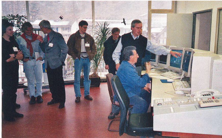
Bild 4 Demonstration der kurzfristigen Deckung von Strombedarfsspitzen im Wasserkraftwerk Göschenen (UR).

Arya erklärte auch den Stand der Deregulation in den USA (Bilder 5 und 6). Bisher seien erst rund 20 Staaten dereguliert, aber es gebe bereits verschiedene «National Generators». Der Referent sah in der Deregulierung den Übergang von Kostenmaximierung zur Gewinnmaximierung: «It's just happens». Die Konvergenz zwischen den Energieträgern werde wachsen. So hätten Wasserkraftwerke, die in letzter Zeit die Hand wechselten, einen höheren Marktwert ($/kW)