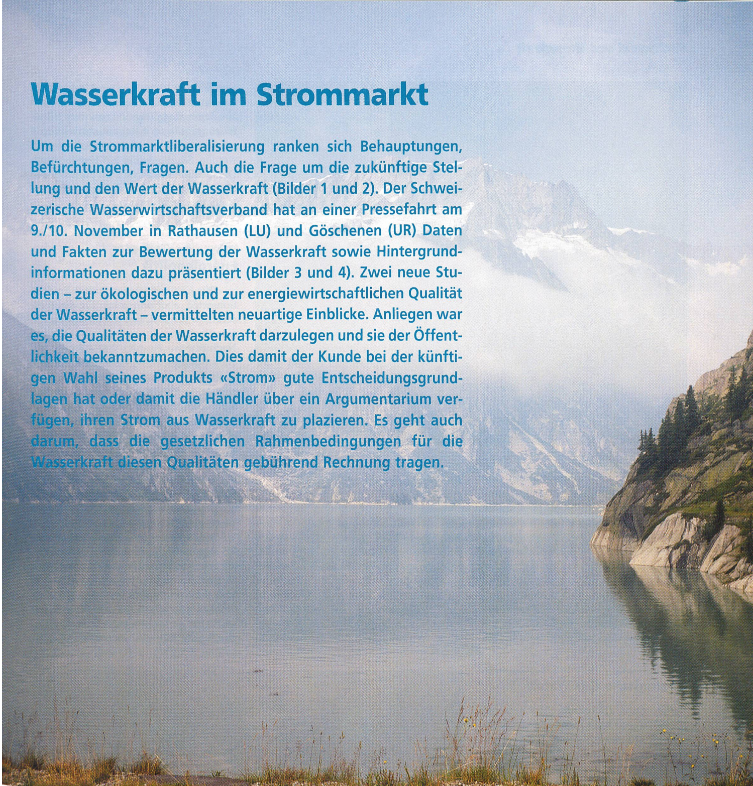
Bild 1 Göschenalpsee mit 75 Mio. m 3 Wasserinhalt.

Um die Strommarktliberalisierung ranken sich Behauptungen, Befürchtungen, Fragen. Auch die Frage um die zukünftige Stellung und den Wert der Wasserkraft (Bilder 1 und 2). Der Schweizerische Wasserwirtschaftsverband hat an einer Pressefahrt am 9./10. November in Rathausen (LU) und Göschenen (UR) Daten und Fakten zur Bewertung der Wasserkraft sowie Hintergrundinformationen dazu präsentiert (Bilder 3 und 4). Zwei neue Studien – zur ökologischen und zur energiewirtschaftlichen Qualität der Wasserkraft – vermittelten neuartige Einblicke. Anliegen war es, die Qualitäten der Wasserkraft darzulegen und sie der Öffentlichkeit bekanntzumachen. Dies damit der Kunde bei der künftigen Wahl seines Produkts «Strom» gute Entscheidungsgrundlagen hat oder damit die Händler über ein Argumentarium verfügen, ihren Strom aus Wasserkraft zu plazieren. Es geht auch darum, dass die gesetzlichen Rahmenbedingungen für die Wasserkraft diesen Qualitäten gebührend Rechnung tragen.