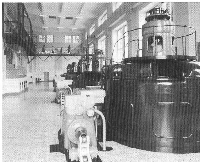
Informationszentrum im aktiven Kraftwerk.

(mb/p) Vom 23. bis 27. Januar 2001 findet in Basel die Schweizer Baumesse Swissbau 01 statt. Bereits sind über 50 000 m 2 Nettoausstellungsfläche belegt. Für die Elektrizitätswirtschaft dürfte vor allem die Sonderschau Energy-net interessant sein. Energy-net präsentiert die Themen nachhaltige Energieversorgung, rationelle Energienutzung sowie Trends und neueste Entwicklungen in den Bereichen Energie, erneuerbare Energien und Minergie.