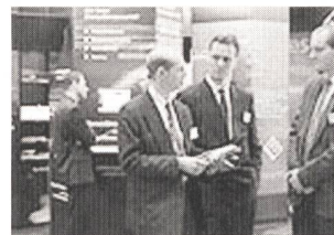
E-World of Energie nimmt die Besucher auf eine Reise in die Welt der Energie.

Der Kanton Bern organisiert bereits seit sieben Jahren Energie-Apéros, an denen durchschnittlich 1500 Gäste teilnehmen. Organisiert werden sie von der kantonalen Bau-, Verkehrs- und Energiedirektion mit Unterstützung verschiedener Unternehmen, Institutionen und Verbände.