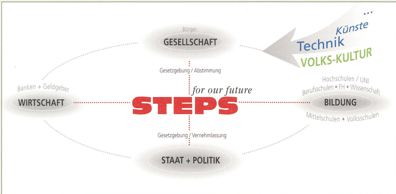
Bild 2 STEPS – Kulturdrehscheibe mit Fokus auf technische Entwicklung und deren Werte

turellen Entwicklung sind, im Besonderen auch einer technischen. Die Kurzlebigkeit technischer Produkte und Systeme, allen voran diejenigen aus der Informationstechnik, steht in einem krassen Gegensatz dazu. In der Tat empfinden wir eine hohe Sinnwidrigkeit vor allem bei denjenigen IT-Lösungen, bei denen die Kompatibilität über zwei bis drei schnelllebige Produktgenerationen dahinschmilzt. Damit verlie-