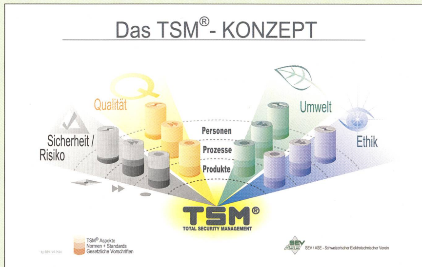
Bild 2 TSM Managementsystem: Umsetzung der Aspekte Sicherheit, Qualität, Umwelt, Ethik auf den drei Ebenen Produkt, Prozess, Person (bzw. Organisation)