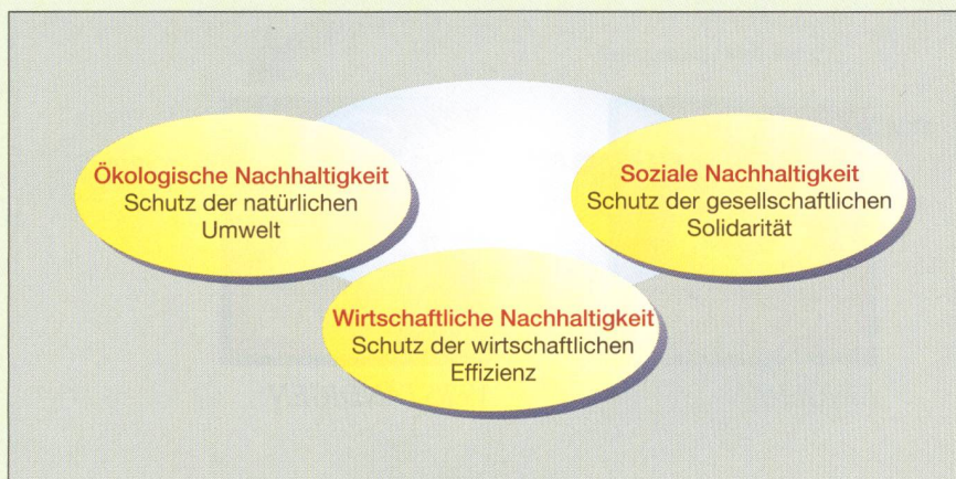
Bild 1 Aspekte des Begriffs Nachhaltigkeit: ökologisch, wirtschaftlich, sozial

Dies gilt auch für die Aspekte der Ethik. Die bereits erwähnte Norm SA 8000 spricht im Inhalt die Themen Kinderarbeit, Zwangsarbeit, Gesundheit und Sicherheit, Freiheit, sich zu organisieren und gemeinsam zu verhandeln, Diskriminierung, disziplinarische Praktiken, Arbeitsstunden, Löhne und Kompensationen, Managementsystem an. Die Regeln und Verfahren zu diesen Themen können nun selbstver-