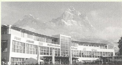
Einkaufszentrum Mythen-Center Schwyz: Gesamtplanung der elektrischen Anlagen durch Elektro-Planung R. Mettler AG