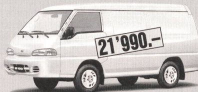
H100 2400 Van Deluxe: 5'650 l Ladevolumen