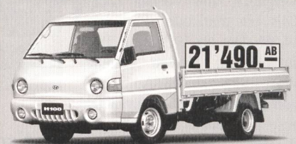
H100 Camionnette mit 2.5 l Turbo-Diesel

Ich möchte einen Nutzfahrzeug-Prospekt eine Probefahrt