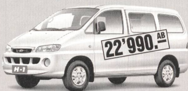
H-1 2400 Combi Deluxe mit 4'600 oder 5'700 l Ladevolumen

H-1 2500 TDI Van mit 2.5 l Turbodiesel Intercooler für Fr. 25'990.-