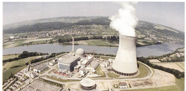
Der Bundesrat hält an der Option Kernenergie fest.

dene sachlich unbegründete Hindernisse in den Weg. Das Parlament ist aufgerufen, durch Verbesserungen ein zukunftstaugliches Gesetz zu erarbeiten. Dies unterstrich die Schweizerische Vereinigung für Atomenergie (SVA) anlässlich der Veröffentlichung der Botschaft des Bundesrates zu den Atominitiativen und zum