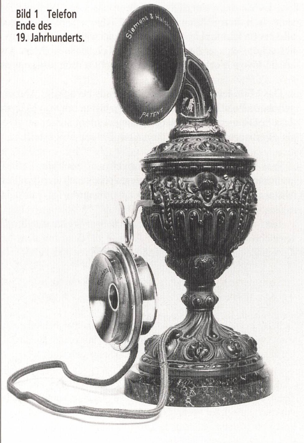
Bild 1 Telefon Ende des 19. Jahrhunderts.

Kontaktadresse Siemens AG Unternehmenskommunikation D-80312 München