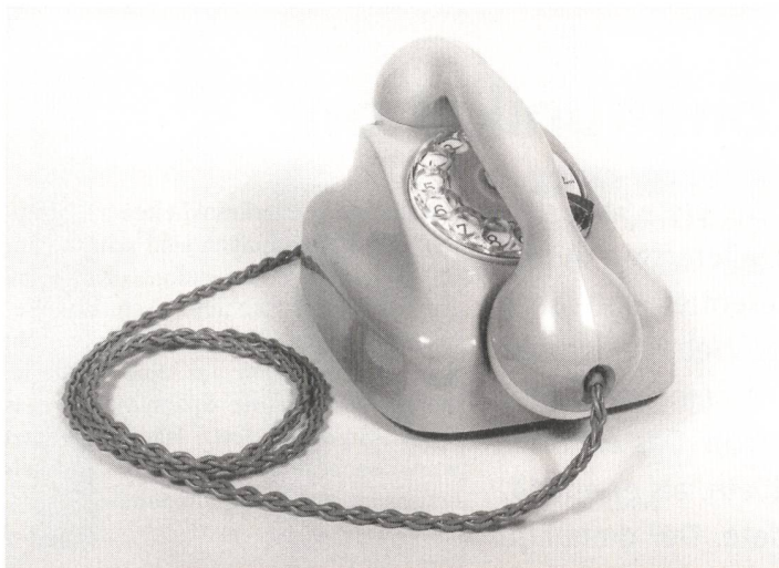
Bild 2 Telefon in den 70er Jahren.

Ihren Namen verdanken die Klappenschränke ihrer Technik: Anrufe werden dem Vermittlungspersonal durch Herabfallen von Nummernklappen signalisiert, die im Ruhezustand von einem Elektromagneten festgehalten werden. Will ein Teilnehmer das Gespräch beenden, muss