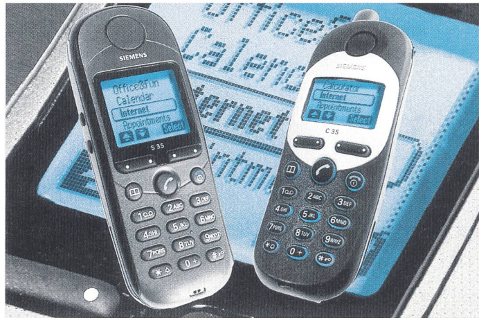
Bild 3 Mobiltelefone im Jahr 2000.

Übertragungskapazitäten der Leitungen und Vermittlungsstellen potenzieren sich um ein Vielfaches und ermöglichen die parallele Übertragung von Sprache und Daten. Die Digitalisierung ist auch Wegbereiter für das Telefax – die Übertragung ganzer Dokumente in Form einer originalgetreuen Kopie.