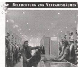
Produkte ins richtige Licht gerückt

Für den Detailhandel spielt die Beleuchtung von Verkaufsräumen und Schaufenstern eine bedeutende Rolle. Das Licht und dessen Führung, seine Intensität und Farbe, sind heute wichtige Marketinginstrumente und tragen zum Verkaufserfolg bei. Eine gute Lichtgestaltung im Eingangs- und Schaufensterbereich animiert den Passanten zum Eintreten. Im Inneren leitet eine gut abgestimmte Lichtführung den Kunden durch den ganzen Laden. Eine ausreichende Grundbeleuchtung und eine gezielte Akzentbeleuchtung sorgen dafür, dass die angebotenen Waren im richtigen Licht erscheinen und das Auge nicht ermüdet. Neben den verkaufstechnischen Aspekten darf aber auch der Energieverbrauch nicht ausser Acht gelassen werden. Die Beleuchtung gehört im Detailhandel zu den wichtigsten Stromverbrauchern und verursacht Energiekosten, die nicht vernachlässigt werden dürfen.