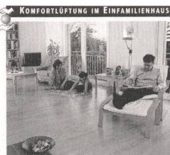
Bessere Luft mit weniger Energie

Fünf neue Gründe, die die kontrollierte Wohnraumlüftung: • für jeden Raum die richtige Lüftungsebene • Reduzierung des Heizenergieverbrauchs • keine Durchzugskälte • Vermeidung von Schimmel • Kostensenkung langfristig durch die Energie