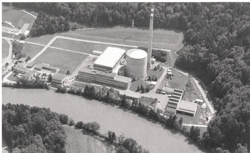
Kernkraftwerk Mühleberg: Internationale Experten loben die Verfügbarkeit und Qualität des Betriebs. Im Jahr 2000 wurden 2829 Mio. kWh Strom produziert.

Das Team führt dies unter anderem auf einen traditionell kleinen Instandhaltungsrückstand und ein umfassendes Programm zur Erfassung von technischen Alterungsmechanismen und -erscheinungen zurück. Insgesamt fand das OSART-Team den traditionell guten und langjährigen Leistungsausweis des KKM während seiner Mission bestätigt.