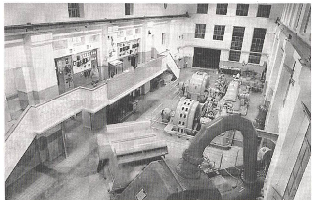
Kraftwerk Lüen: drei Epochen von Stromerzeugungsanlagen.

Auf dem geführten Rundgang durch die Werkanlage kann die alte und neue Technik der Wasserkraftnutzung bestaunt werden. Besonders stolz ist Arosa Energie auf die nostalgische und museumswürdige Werk-