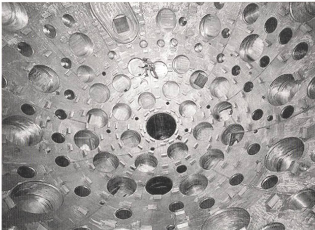
Ansicht der Auffangkammer

schmelzen, so dass eine Kernfusion entsteht. Dabei wird eine ungeheure Energiemenge freigesetzt. Diese Energiemenge ist so gross, weil sich Licht extrem komprimieren lässt. 4 \cdot 10^{24} Photonen passen in eine bombongrosse Auffangkapsel. Bisher ist die Kernfusion mit Licht aber noch niemandem gelungen. Den amerikanischen NIF-Technikern sollen 3,4 Mrd. Dollar für dieses Projekt zur Verfügung stehen, mit dem langfristig gesehen eine Energiequelle angezapft werden soll, die zum einen unerschöpflich und billig und zum anderen umweltfreundlich ist. – Quelle Text und Bild: www.nationalgeographic.de