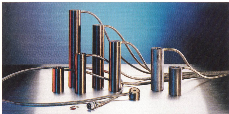
Bild 2 Induktive Sensoren mit Betriebsbewährung von über 20 Jahren.