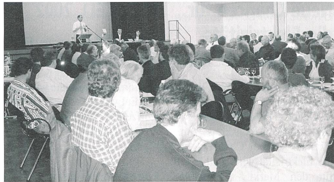
Gut besuchte VTE-Generalversammlung im schönen Gemeindezentrum von Aadorf.

Führer Expo.02, Werd Verlag, Zürich, 384 S., Broschiert, Fr. 15.–, ISBN 3-85932-388-1(d).