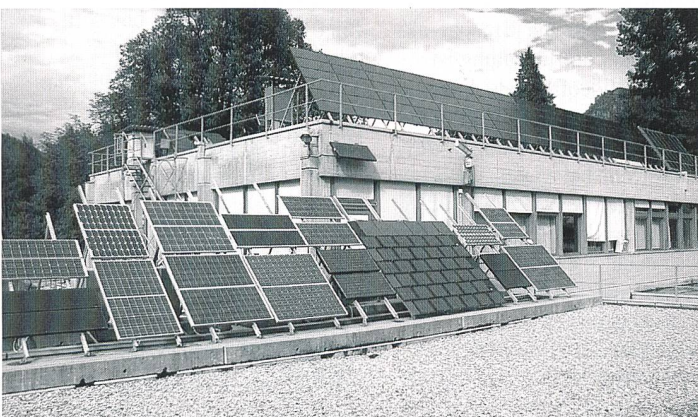
Teststand für Solarmodule am LEEE-TISO (Laboratorio di Energia, Ecologia ed Economia-Ticino Solare in Cannobbio.

Schweizerischer Wasserwirtschaftsverband, Rütistrasse 3a, 5401 Baden, Tel. 056 222 50 69, Fax 056 221 10 83, E-Mail: r.fuellemann@swv.ch, Internet: www.swv.ch.