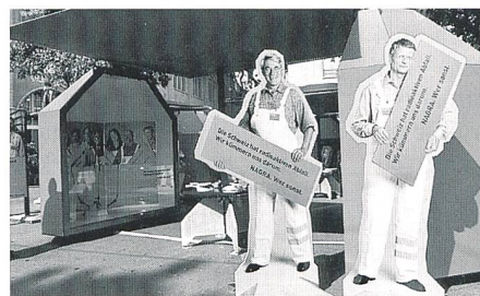
Auch am Zürcher Paradeplatz stellte sich die Nagra vor.

Der Wissensstand über die Entsorgung radioaktiver Abfälle in der Schweiz soll verbessert werden. Zu diesem Zweck startete die Nagra am 11. Juni in Bern eine nationale Informationskampagne.