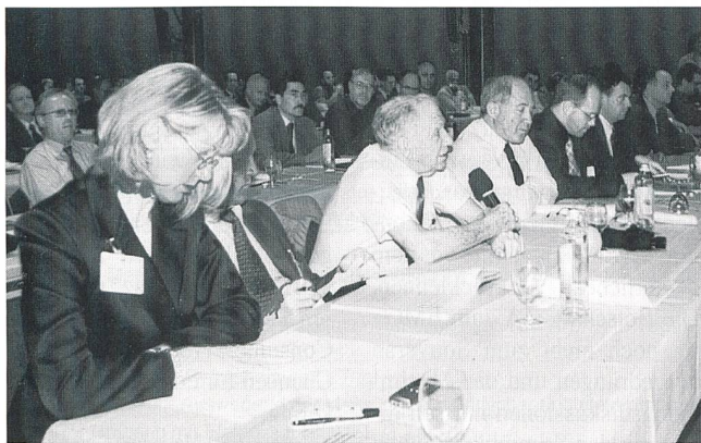
Vor allem über die Frage, ob Windenergie die Kernkraft wirklich und effizient ersetzen kann, wurde rege diskutiert.

nicht präsentiert werden. Deshalb lautete ein einhelliges Fazit der Veranstaltung: Die Schweiz darf sich die Option Kernenergie nicht verbauen und sie soll ihre bestehenden Kernkraftwerke so lange wie